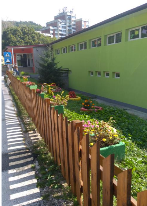
Објекат у Мајданпеку

Број деце је стално растао и убрзо је постао знатно већи од изграђеног капацитета, па је 1974-те године, поред првог изграђен још један дечији објекат. Две године касније дошло је до новог проширивања капацитета у Мајданпеку, адаптацијом дела простора у солитеру „Звезда“. Током 1978-е године, основан је путујући вртић у насељу Рудна Глава, Црнајка, Клокочевац и Мосна. Укупан број деце у путујућем вртићу био је 120, а у дечијем вртићу ове Установе још 230. Крајем осамдесетих година уследило је отварање васпитних група полудневног боравка у насељима Лесково, Јасиково и Влаоле. Све то је допринело да се и број деце у овој установи повећа на 580.