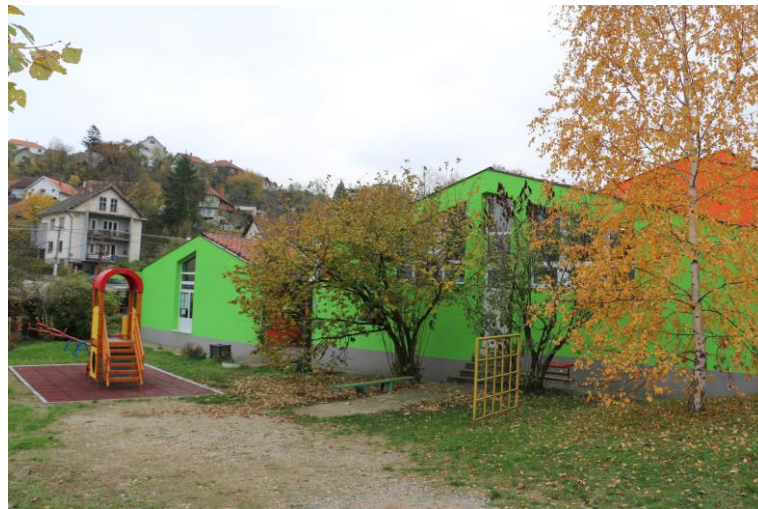
Објекат у Доњем Милановцу

1974. године дечијем вртићу у Мајданпеку припојено је и Забавиште Доњи Милановац. У Доњем Милановцу 1984-те године отворен је нови објекат са 4 радне собе. Сада у Доњем Милановцу борави око 60 –торо деце у једној јасленој и 3 васпитне групе.