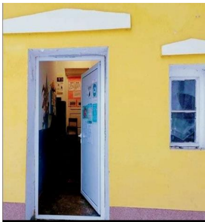
Објекат у Рудној Глави